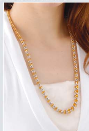
スライドをバックにした場合