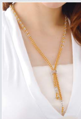
スライドをフロントにした場合

DN1～3の半貴石の種類は変更も可能ですので、ご希望がございましたらお問い合わせ願います。