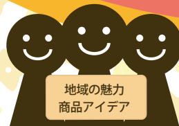
地域おこし協力隊