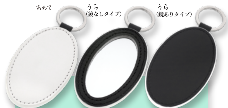
PLATE & MIRROR

45×75 楕円型 (鏡なし): W45×H75×D3 (mm) 45×75 楕円型 (鏡あり): W45×H75×D3.5 (mm)