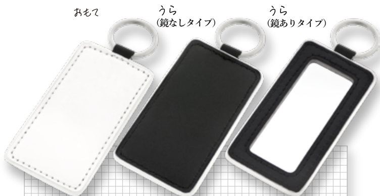
PLATE & MIRROR

40×75 角型 (鏡なし): W40×H75×D3 (mm) 40×75 角型 (鏡あり): W40×H75×D3.5 (mm)