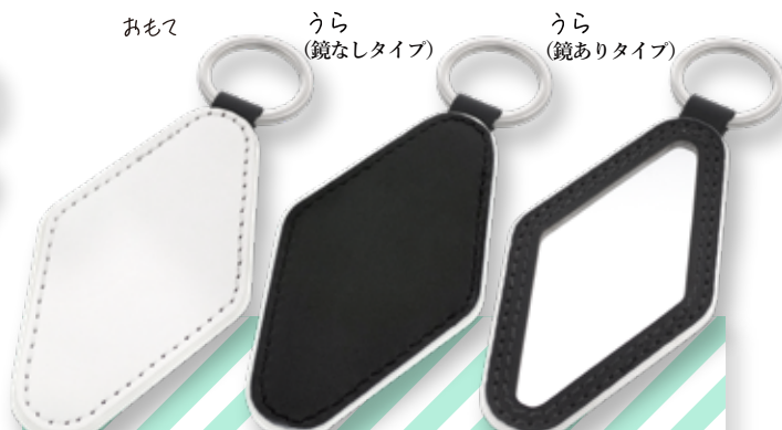
PLATE & MIRROR

43×84 モーターキー型 (鏡なし): W43×H84×D3 (mm) 43×84 モーターキー型 (鏡あり): W43×H84×D3.5 (mm)